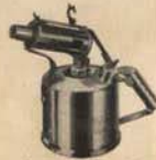
No 411 Cubida: 0,5 litros No 431 Cubida: 1,0 litros