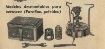
Modelos desmontables para kerosene (Parafina, petróleo)