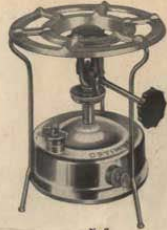
No 7 Cabida: 1,3 litros Equipado con quemador silencioso regulable con dispositivo de limpieza automática