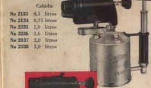
Cabida: No 2133 0,5 litros No 2134 0,75 litros No 2232 1,0 litros No 2236 1,6 litros No 2337 2,0 litros No 2338 3,0 litros