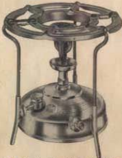
No 45 "ruidoso" Cabida: 1,1 litros No 46 "silencioso" " 1,1 litros