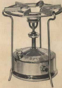
No 2 Cabida: 2,5 litros No 3 " 4,0 litros No 23 " 2,5 litros Ruidosos