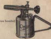
Cabida: No 1211 0,25 litros No 1212 0,34 litros No 1222 0,34 litros (con bomba)