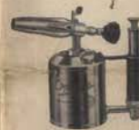
Cabida: No 1432 0,5 litros No 1434 0,75 litros