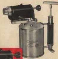
Cabida: No 5134 0,75 litros No 5236 1,6 litros No 5237 2,0 litros No 5338 3,0 litros

Estos sopletes están provistos de dispositivo automático de limpieza. Nos 5236, 5237 y 5338 se pueden suministrar con encendedor rápido que reduce el tiempo de encendido con 3/4 partes del tiempo normal.