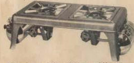
Equipado con quemadores silenciosos regulables con dispositivo de limpieza automática. Indicador de nivel en cada tanque.