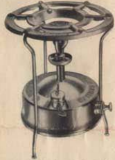
No 1 "ruidoso" Cabida: 1,3 litros No 5 "silencioso" " 1,3 litros