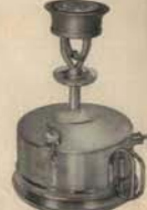
No 531 Cubida: 3 litros Ebullición de 30 Ltrs. de agua en aprox. 15 min.