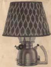
No 930A es idéntica con linternas No 930 pero provista de pantalla de tela No 151n asa No 159 cinta de fijación No 160 - Una atractiva y práctica lampara de mesa.